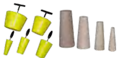
En polyuréthane pour produits chimiques En bois pour hydrocarbures