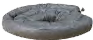
Des boudins Pour contenir et stopper la fuite.