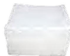
Des essuyeurs Pour nettoyer correctement tous les outils et le matériel réutilisable avant toute nouvelle utilisation.