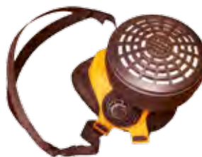
Un masque En cas de manipulation de produits chimiques.