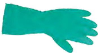
Une paire de gants Équipement E.P.I. obligatoire à mettre en préventif.