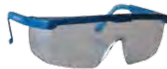
Une paire de lunettes En cas de manipulation de produits dangereux.