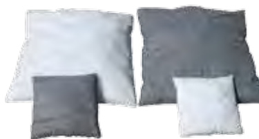
Des coussins Pour absorber les fluides qui s'écoulent dans les espaces étroits.