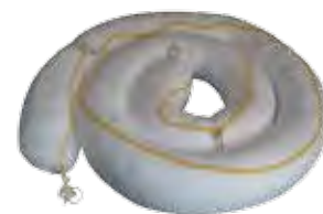
Des barrages Permettent de contenir la propagation d'hydrocarbures et d'absorber les pollutions sur l'eau.