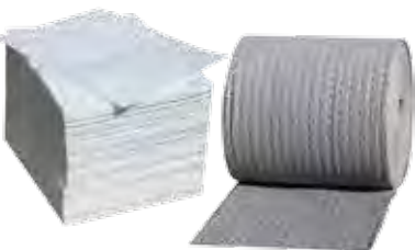
Des feuilles et rouleaux Pour absorber les liquides déversés.

Les plus grands modèles : feuilles, boudins, coussins, rouleaux absorbants, sacs de récupération, gants de protection etc.