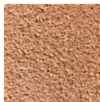
Des granulés Gamme de granulés 100% naturelle dotée d'un fort pouvoir d'absorption.